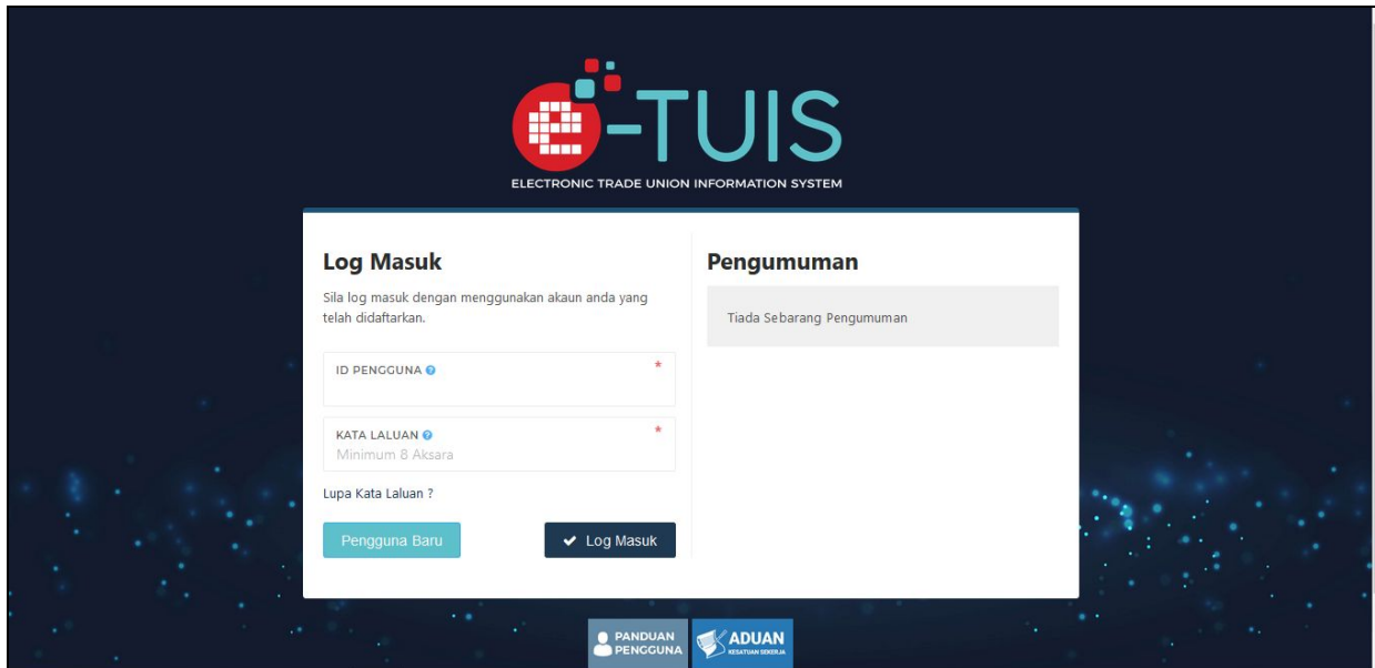
Halaman Log Masuk