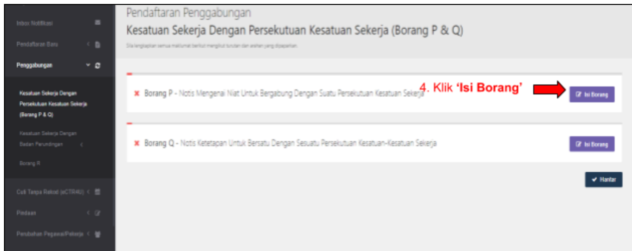
Paparan Halaman Pendaftaran Penggabungan Kesatuan Sekerja Dengan Persekutuan Kesatuan Sekerja (Borang P&Q)