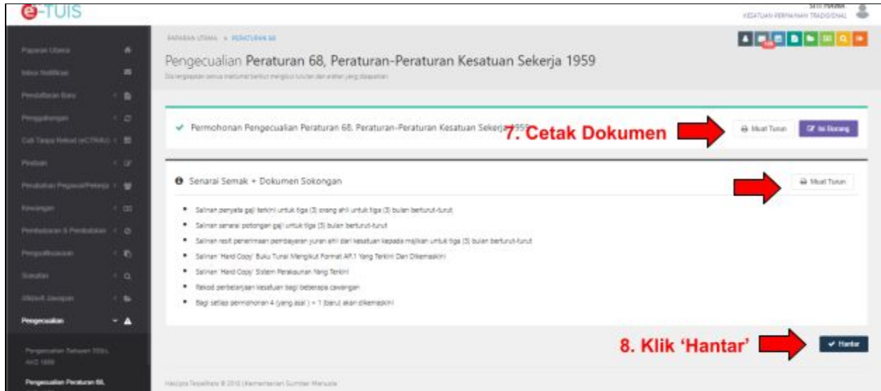
Paparan Halaman Permohonan Pengecualian Peraturan 68, AKS 1959.