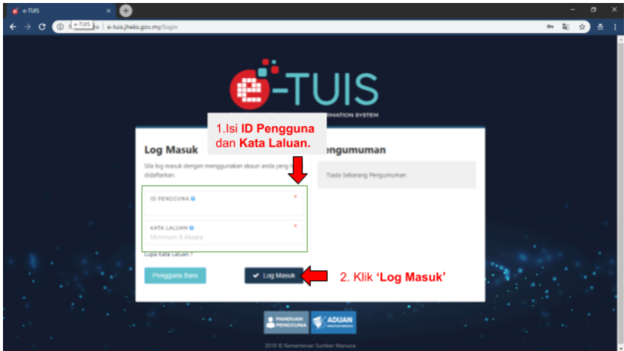
Paparan Halaman Log Masuk.